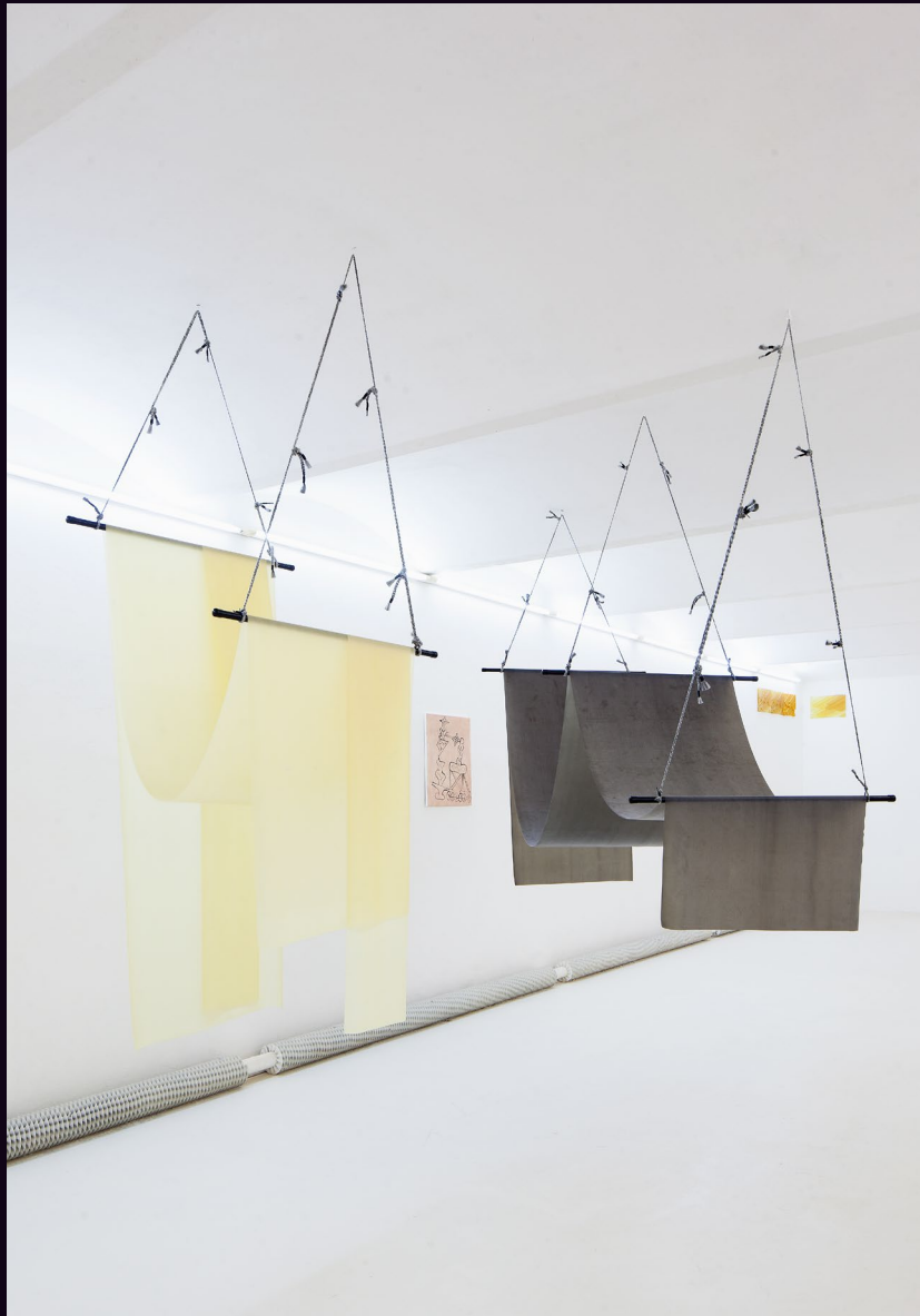
Ieva Kraule: Drooping Skin. Day 1 Drooping Skin. Day 2